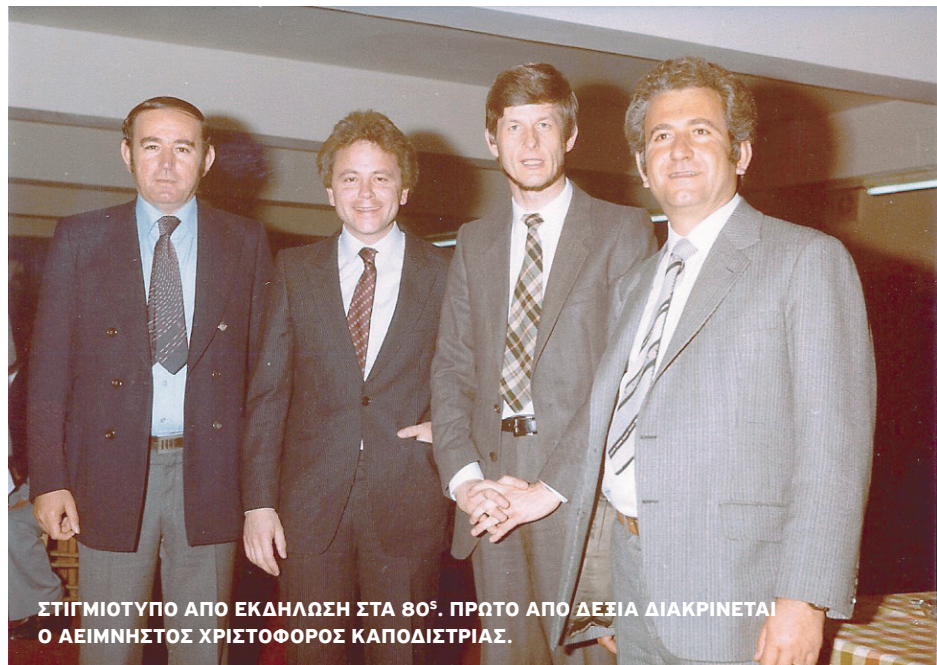
ΣΤΙΓΜΙΟΤΥΠΟ ΑΠΟ ΕΚΔΗΛΩΣΗ ΣΤΑ 80 Σ . ΠΡΩΤΟ ΑΠΟ ΔΕΞΙΑ ΔΙΑΚΡΙΝΕΤΑΙ Ο ΑΕΙΜΝΗΣΤΟΣ ΧΡΙΣΤΟΦΟΡΟΣ ΚΑΠΟΔΙΣΤΡΙΑΣ.