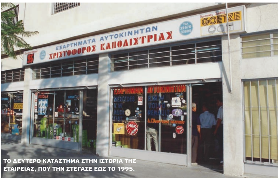
ΤΟ ΔΕΥΤΕΡΟ ΚΑΤΑΣΤΗΜΑ ΣΤΗΝ ΙΣΤΟΡΙΑ ΤΗΣ ΕΤΑΙΡΕΙΑΣ, ΠΟΥ ΤΗΝ ΣΤΕΓΑΣΕ ΕΩΣ ΤΟ 1995.

σμένες από τις μεγαλύτερες αυτοκινητοβιομηχανίες του κόσμου. Τέτοια εργοστάσια ήταν η «Motorservice International» που έφτιαχνε τα «K.S. Pistons» τα οποία χρησιμοποιούσε στα αυτοκίνητά της η Mercedes, ενώ το ίδιο εργοστάσιο προμήθευε με γνήσια ανταλλακτικά αυτοκινητοβιομηχανίες όπως Volkswagen, Porsche και Ford. Σύντομα στη γκάμα εντάσσονται προϊόντα του Ομίλου «Schaeffler» και της «ZF Friedrichshafen», δύο κολλοσιαίων γερμανικών εταιρειών. Το 1977 η εταιρεία μετακομίζει σε νέο κατάστημα ενώ ήδη λειτουργεί και κατάστημα στη Λάρνακα. Η επόμενη δεκαετία βρίσκει την Καποδίστριας με κατα-