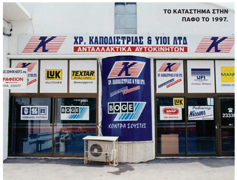
ΤΟ ΚΑΤΑΣΤΗΜΑ ΣΤΗΝ ΠΑΦΟ ΤΟ 1997.