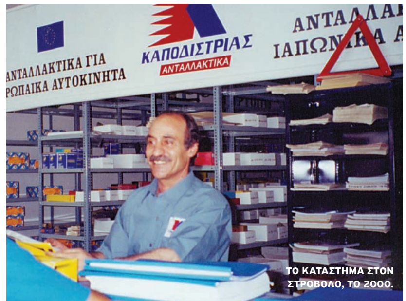
ΤΟ ΚΑΤΑΣΤΗΜΑ ΣΤΟΝ ΣΤΡΟΒΟΛΟ, ΤΟ 2000.