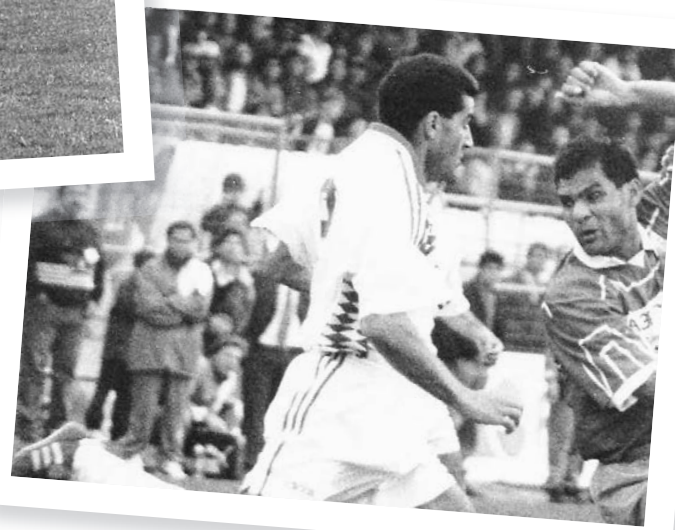
Ο Αιγύπτιος μέσος με αντίπαλο τον Μαλέκκο σε ντέρμπι Ανόρθωσης - Ομόνοιας.