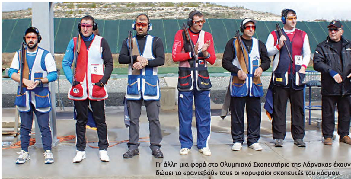
Γ' άλλη μια φορά στο Ολυμπιακό Σκοπευτήριο της Λάρνακας έχουν δώσει το «ραντεβού» τους οι κορυφαίοι σκοπευτές του κόσμου.

η 28η Απριλίου είναι η μέρα της επίσημης άφιξης των ξένων αποστολών και η 8η Μαΐου η μέρα αναχώρησής τους. Η τελετή έναρξης είναι προγραμματισμένη για το απόγευμα του Σαββάτου 29 Απριλίου, μετά την ολοκλήρωση της επίσημης προπόνησης του σκι.