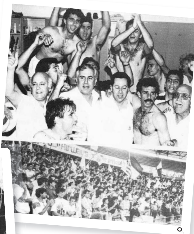
Οι παίκτες στα αποδυτήρια και ο κόσμος του Απόλλωνα στο «Τσίρειο» πανηγυρίζουν την κατάκτηση του τίτλου.