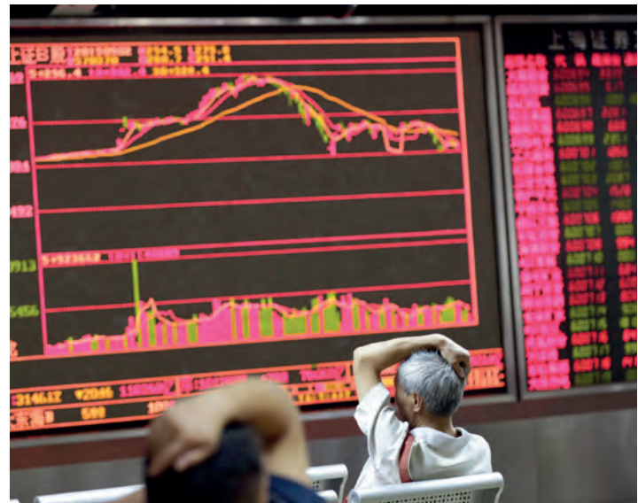
Photo of the week // Πάλι κάτω η Κίνα...

Συνεχής νευρική κατάσταση παρατηρήθηκε και αυτή την εβδομάδα στην κινεζική αγορά, καθώς μετά το δραματικό βύθισμα των δεικτών την προπερασμένη εβδομάδα ο δείκτης παρουσίασε και αυτή την εβδομάδα σκαμπεναβασμάτα. Η φωτογραφία είναι από το Χρηματιστήριο του Πεκίνου την Τετάρτη, όπου οι μετοχές άνοιξαν με πτώση πάνω από 4%.