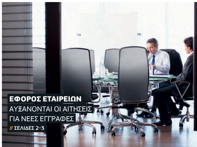
ΕΦΟΡΟΣ ΕΤΑΙΡΕΙΩΝ ΑΥΞΑΝΟΝΤΑΙ ΟΙ ΑΙΤΗΣΕΙΣ ΓΙΑ ΝΕΕΣ ΕΓΓΡΑΦΕΣ // ΣΕΛΙΔΕΣ 2-3