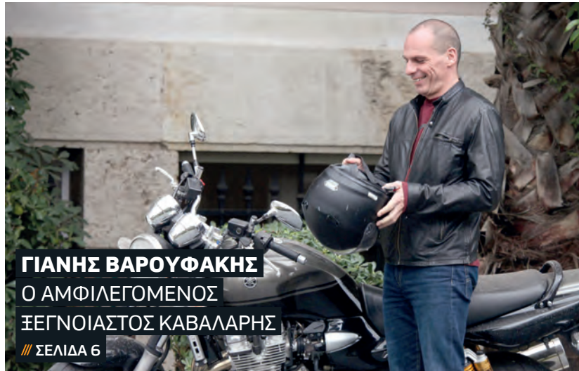
ΓΙΑΝΗΣ ΒΑΡΟΥΦΑΚΗΣ Ο ΑΜΦΙΛΕΓΟΜΕΝΟΣ ΞΕΓΝΟΙΑΣΤΟΣ ΚΑΒΑΛΑΡΗΣ // ΣΕΛΙΔΑ 6