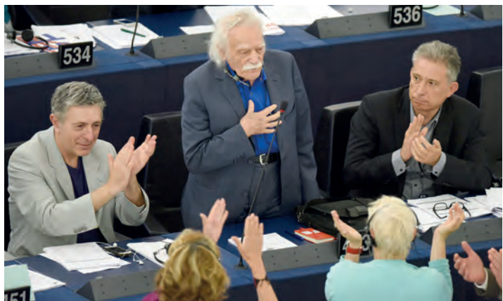
Photo of the week // Καταχειροκροτήθηκε ο Γλέζος

Συγκλονιστική ήταν η ομιλία του Μανώλη Γλέζου την Τετάρτη στο Ευρωκοινοβούλιο. Ο ευρωβουλευτής του ΣΥΡΙΖΑ τόνισε ότι «η Ευρώπη είναι γέννημα της Ελλάδας. Δεν σας τη χαρίζουμε την Ευρώπη» και πρόσθεσε πως «ζητάμε να θριαμβεύσει το δίκιο». Και συνέχισε αναφέροντας ότι υπάρχει διαφωνία απόψεων, αλλά εν θερμώ δεν θα υπάρξει λύση. Οι ευρωβουλευτές καταχειροκρότησαν τον κ. Γλέζο μετά την ομιλία του.