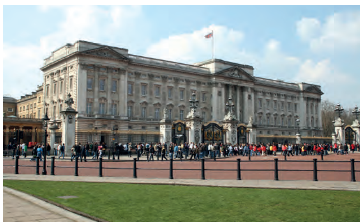
Photo of the week // Γιατί η Ελισάβετ αφήνει το Μπάκιχαμ

Εγκαταλείπει -για λίγο- τα ανάκτορα του Μπάκιχαμ η βασίλισσα Ελισάβετ, προκειμένου να πραγματοποιηθούν οι εργασίες συντήρησης, οι οποίες αναμένεται να κοστίσουν 150 εκατ. λίρες (περίπου 200 εκατ. ευρώ), όπως αναφέρει το BBC. Το παλάτι χρειάζεται αλλαγές στα υδραυλικά και τα ηλεκτρολογικά, ενώ δεν έχει γίνει καμία αλλαγή στη διακόσμηση από το 1952, οπότε και ενθρονίστηκε η Ελισάβετ. Η είδηση αυτή έρχεται λίγες μέρες αφού οι βασιλικοί λογιστές ανακοίνωσαν ότι η μοναρχία κοστίζει στους Βρετανούς φορολογούμενους περίπου 35,7 εκατομμύρια λίρες για δεύτερη συνεχή χρονιά. Η 89χρονη βασίλισσα εορτάζει το 1/3 του χρόνου της σε εκδηλώσεις που γίνονται στο Μπάκιχαμ, η οποία είναι η επίσημη κατοικία της οικογένειας στο Λονδίνο.